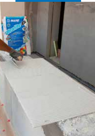
Нанесение клея на тыльную сторону плит