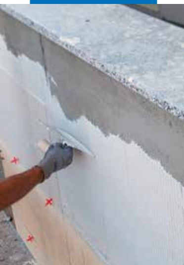
Облицовка фасада: нанесение клея на основание.

Нет необходимости смачивать плитки перед укладкой; только в случае, если тыльная сторона плитки слишком пыльная, рекомендуется промыть плитку погружением в чистую воду.