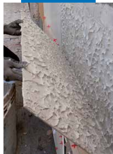
Контроль покрытия клеем тыльной стороны плит при облицовке фасада.