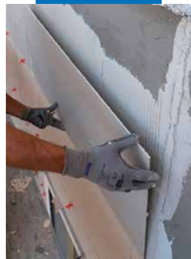
Укладка тонкого керамогранита на фасад